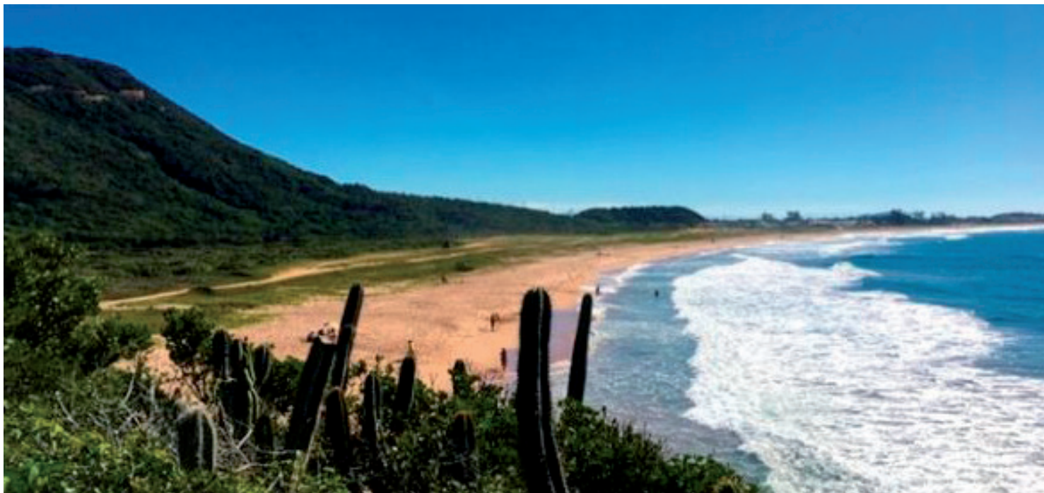
Praia de Tucuns, em Armação dos Búzios, faz parte da Proteção Ambiental (APA) do Pau Brasil