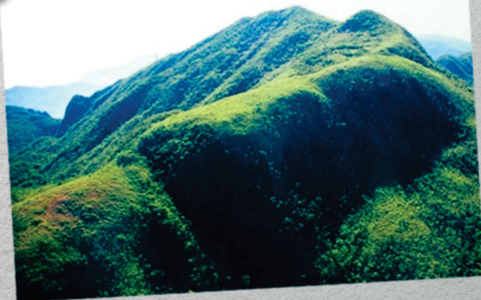
Topo de Morros