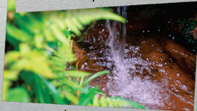
Nascente de Rio