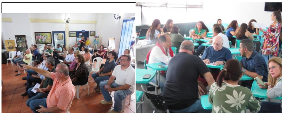
Figura 1: Oficinas de Participação Social Para Revisão do Plano de Recursos Hídricos na RH VI