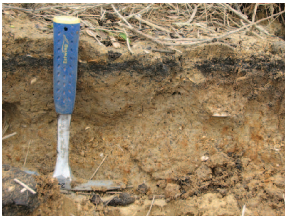
Figura 3 Depósito localizado na foz do rio Una, com detalhe para forma lenticular da camada.

O depósito da foz do rio Una é o mais próximo da linha de praia atual e ocorre em forma lenticular (Figura 3). Esse depósito ainda não foi descrito em nenhuma bibliografia, mas em uma verificação preliminar foi possível perceber que as conchas encontram-se altamente fragmentadas impossibilitando uma análise taxonômica. O depósito apresenta aproximadamente 0,25 m de espessura. Devido ao estado de preservação das conchas a formação desse depósito pode estar relacionada a processos de leques de sobrelavagem ( overwash ).