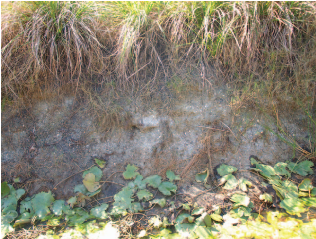
Figura 6 Depósito localizado em Campos Novos com detalhe para grande espessura da camada e o moderado grau de empacotamento.

Na região conhecida como pântano do Trimumú, no distrito de Campos Novos, há ocorrência de uma extensa camada de conchas. Nessa localidade a espessura da camada moderadamente empacotada chega a 0,90 m (Figura 6). Esse depósito foi citado primeiramente por Senra et al. (2004) e, segundo os autores, a malacofauna é composta por 16 espécies de bivalvíos, 8 de gastrópode e 1 de escafópode. As conchas encontradas nesse depósito apresentam graus de preservação diferentes e as análises paleoambientais e tafonômicas permitem inferir que foi formado em um ambiente estuarino (Bernardes, 2008).