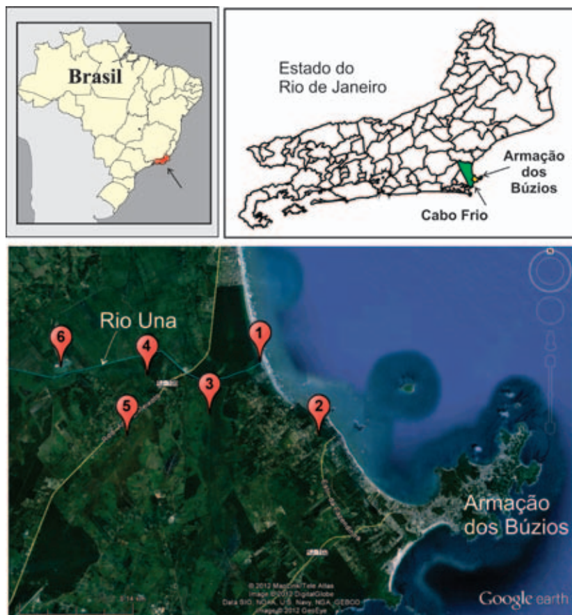
Figura 1 Mapa de localização dos afloramentos de acumulações bioclásticas ao longo da planície costeira do rio Una, Municípios de Cabo Frio e Armação dos Búzios, Litoral Leste do Estado do Rio de Janeiro. (1 – Desembocadura do rio Una; 2 – Canal Marina Porto Búzios; 3 – Pântano da malhada; 4 – Fazenda Campos Novos; 5 – Condomínio Portal de Búzios; e 6 – Fazenda Araçá).

Aline Meneguci da Cunha; João Wagner de Alencar Castro & Fábio Ferreira Dias