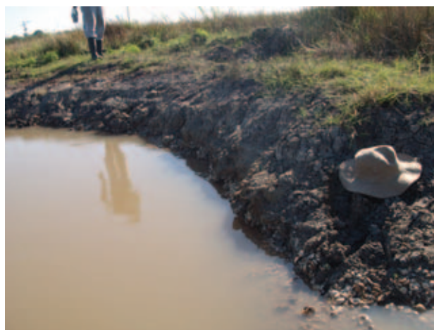
Figura 7 Depósito localizado no condomínio Portal de Búzios com detalhe para a pequena espessura da camada.

permite inferir que esse depósito foi formado em águas calmas, rasas e condição hipersalínica, corroborada pela predominância de A. brasiliiana .