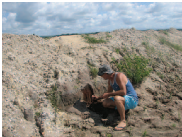
Figura 8 Montículos de areia encontrados na Fazenda Araçá ao lado dos lagos gerados pelas frentes de lavras de areia.

No depósito localizado na fazenda Araçá não é possível visualizar a espessura e o grau de empacotamento da camada. As conchas se encontram em montículos de sedimentos nas bordas das frentes de lavras de exploração de areia (Figura 8). A malacofauna ainda está em processo de identificação e foram encontradas também fragmentos de equinóides (bolacha-do-mar) e de crustáceos (caranguejo).