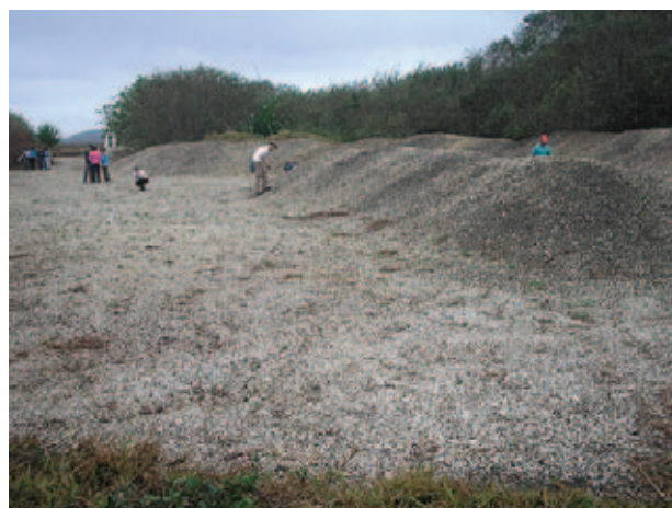
Figura 4 Depósito encontrado na Reserva Tauá. Observar a grande extensão lateral da camada.

Outro extenso depósito é conhecido em uma área adjacente da planície do rio Una e foi citado na literatura por Martin et al. (1997). Nesse ponto são distinguíveis duas camadas bioclásticas de geometria tabular, sendo separadas por uma camada de areia lamosa com lentes de lama orgânica (Figura 5). A camada inferior é densamente empacotada e a espessura varia entre 0,10 a 0,30 m. A camada