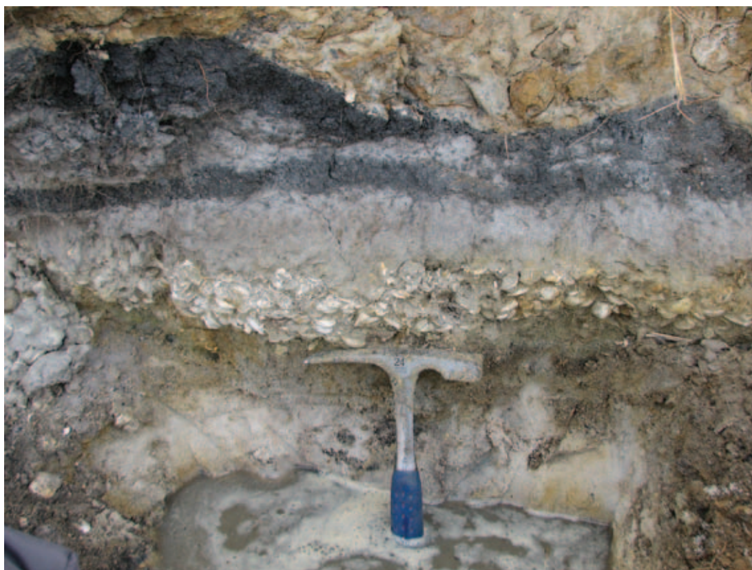
Figura 5 Depósito localizado no canal do empreendimento náutico Marina Porto Búzios com detalhe para o alto grau de empacotamento da camada.

superior é frouxamente empacotada e os bioclastos se encontram dispersos em uma matriz arenosa. Nesse depósito a diversidade das espécies de moluscos é muito baixa, com predomínio de Anomalocardia brasiliana , seguida de Lucina pectinata , Crassostrea rhizophorae e Cerithium atratum . As conchas se encontram em ótimo estado de preservação inclusive com algumas valvas articuladas.